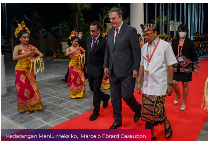
Kedatangan Menlu Meksiko, Marcelo Ebrard Casaubon