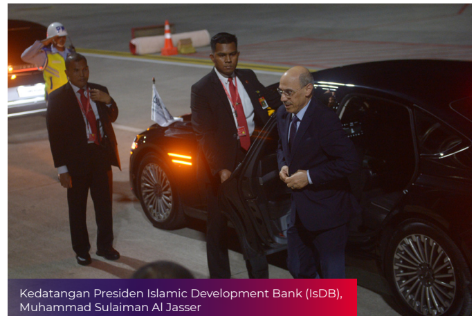
Kedatangan Presiden Islamic Development Bank (IsDB), Muhammad Sulaiman Al Jasser