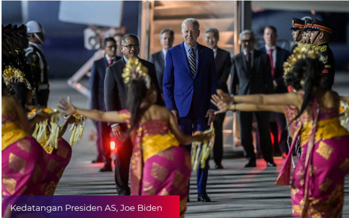
Kedatangan Presiden AS, Joe Biden