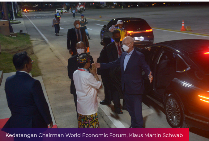
Kedatangan Chairman World Economic Forum, Klaus Martin Schwab