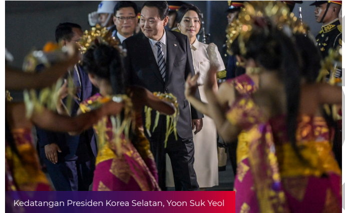
Kedatangan Presiden Korea Selatan, Yoon Suk Yeol