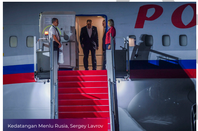
Kedatangan Menlu Rusia, Sergey Lavrov