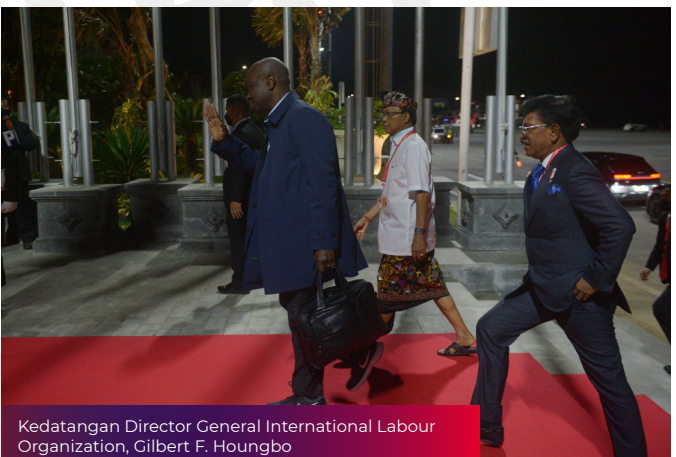
Kedatangan Director General International Labour Organization, Gilbert F. Houngbo