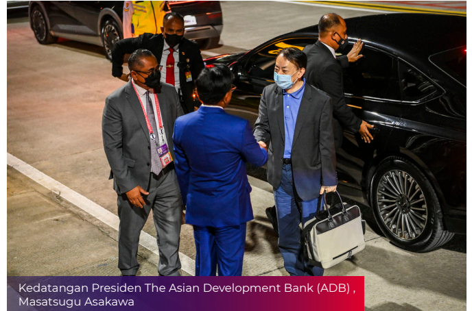
Kedatangan Presiden The Asian Development Bank (ADB), Masatsugu Asakawa