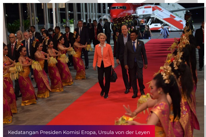
Kedatangan Presiden Komisi Eropa, Ursula von der Leyen