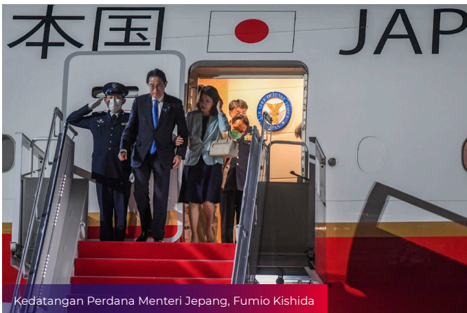
Kedatangan Perdana Menteri Jepang, Fumio Kishida