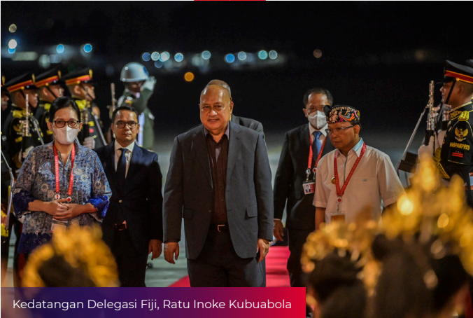
Kedatangan Delegasi Fiji, Ratu Inoke Kubuabola